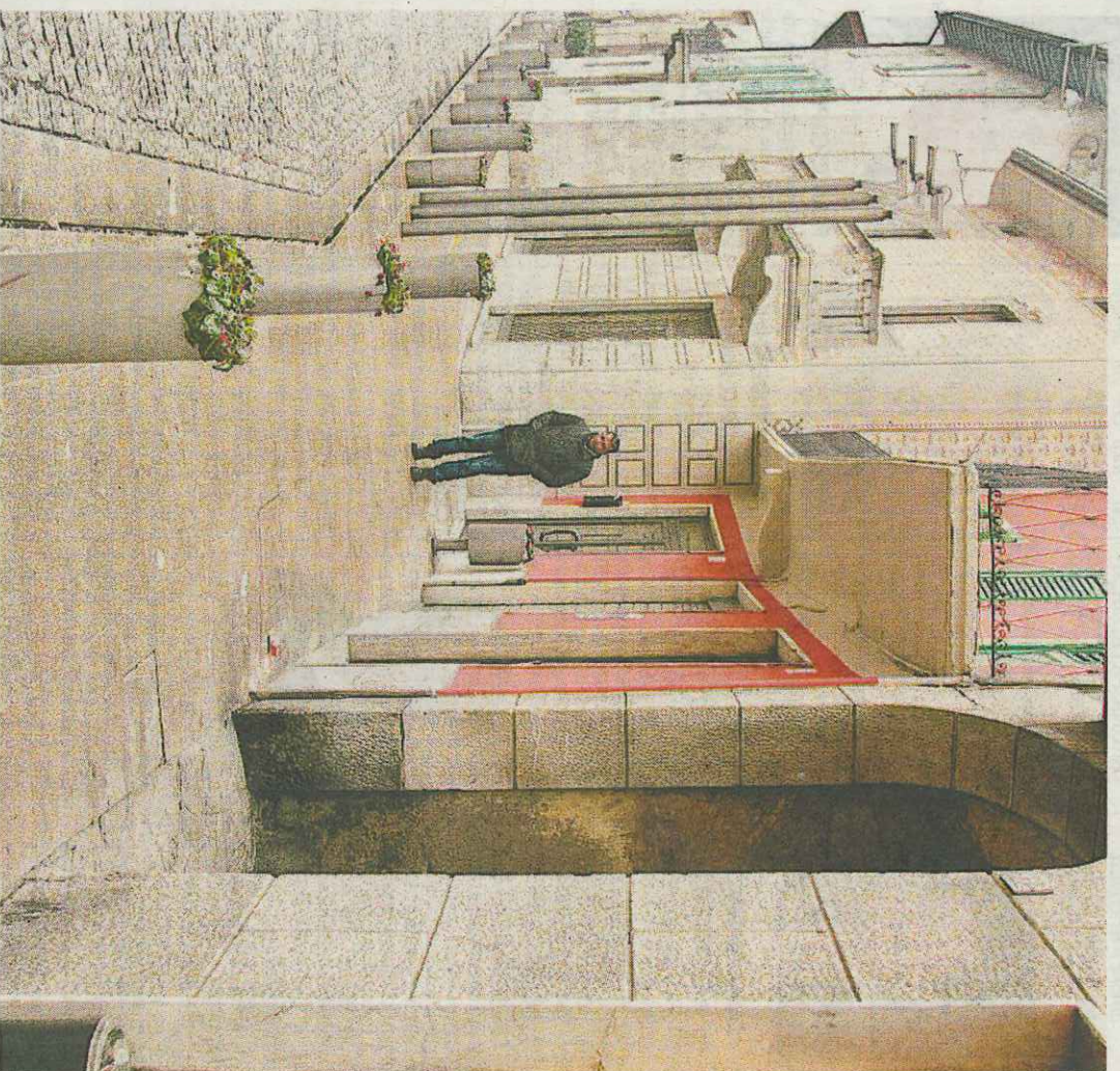
In vista dell'estate si rilanciano il dibattito sul recupero del centro storico di Seriate