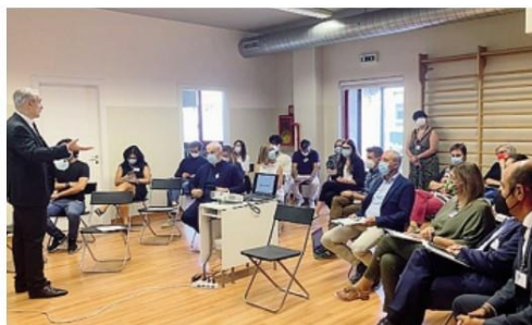
Un momento della presentazione dell'iniziativa